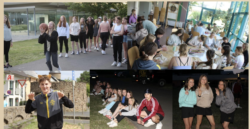
Ferienlager 2023 Rheinbach